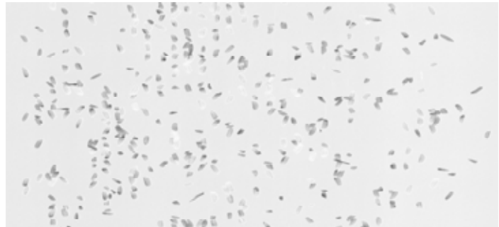
A50-28J镜头色选应用成像样图